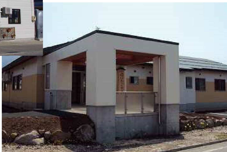
木島平村支社（往郷）